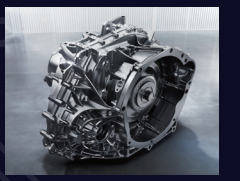
Transmisión automática DCT 7 velocidades