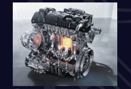
Motor 1.6 TGD

Carga inalámbrica Wireless (carga rápida de 50W para teléfonos móviles)